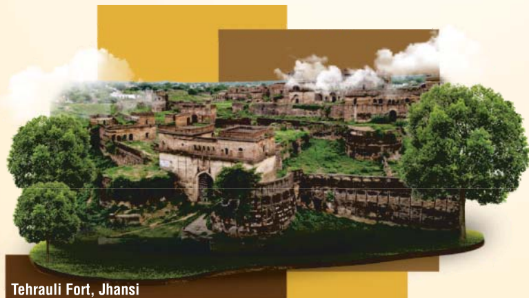
Tehrauli Fort, Jhansi

From Interested bidders for Adaptive Reuse of the 16 Heritage Properties in Uttar Pradesh